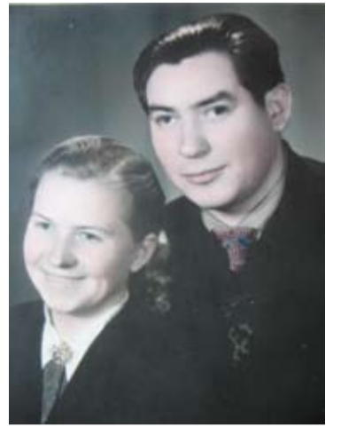
Su žmona Maryte jungtaviūtė dieną. Kartu nugyveno pusę amžiaus.

kevičiai pardavė namus Svėdasuose ir, nusipirkę butą, persikėlė į Anykščius.