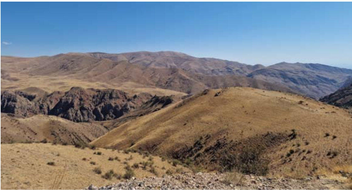
Iprastinis Armėnijos peizažas...

Vidmantas ŠMIGELSKAS vidmantas.s@anyksta.lt