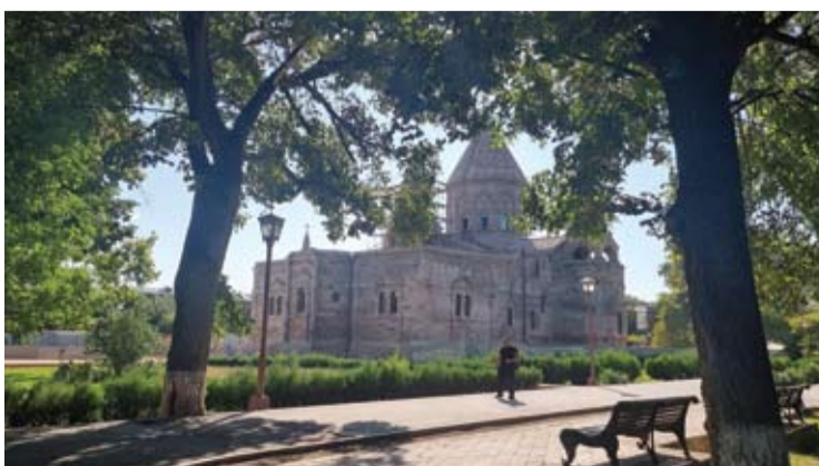
Pagrindinė armėnų šventykla - Ečmiadzino katedra, pastatyta 303 metais, yra viena seniausių šventyklų pasaulyje.