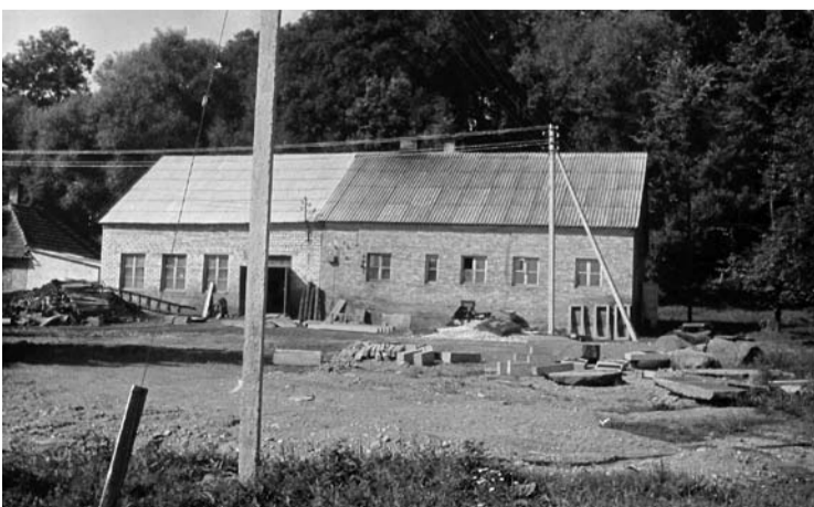
Šis statinys - kavarskiečių pirtis, statyta iš vietinių plytų.