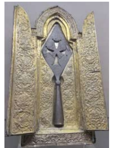
Viena iš keturių pasaulyje žinomų iečių, kuria, sakoma, buvo pervertas mūsų Išganytojo kūnas.