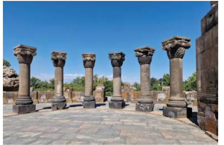
Zvartnoc šventyklos liekanos. Teigiama, kad ši šventykla buvusi ankstyvųjų viduramžių architektūros šedevras.

(civiliniame gyvenime - Ktič Nersisjan) yra baigęs Bonos ir Vienos universitetus, studijavo Maskvos pravoslavų cerkvės dvasinės akademijos aspirantūroje. Armėnų bažnyčios apieigos yra katalikiškos, tačiau Katolikui aspirantūra pravoslavų akademijoje netapo našta ar kliūtimi. Beje, armėnų dvasininkai gali kurti šeimas, tačiau šeimas sukūrusieji negali siekti aukštesnės bažnytinės karjeros. Vedę kunigai pasmerkti visą gyvenimą likti eiliniams savo paraprijiečių ganytojais.